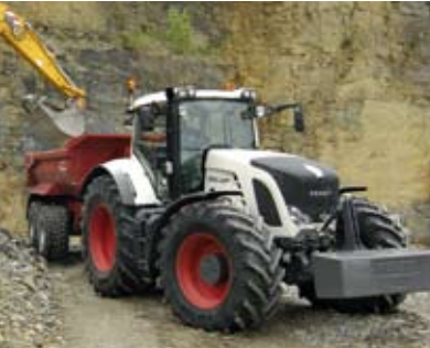
Bauwirtschaft und Transport