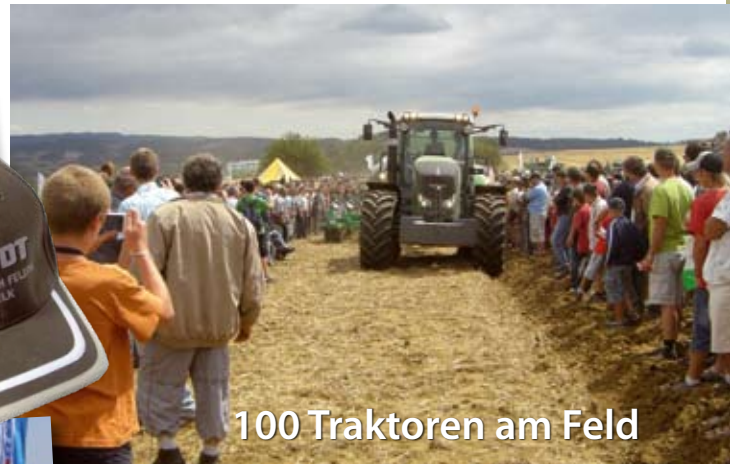
100 Traktoren am Feld