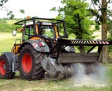
Gehölze und Forst