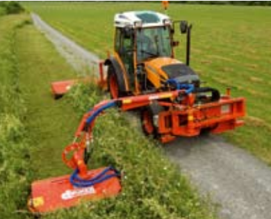
Mähen und Pflegen